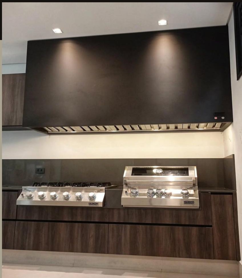
COIFA CAIXOTE PINTADA

Para informações de preço, instalação e outros modelos de produto, consultar o vendedor.