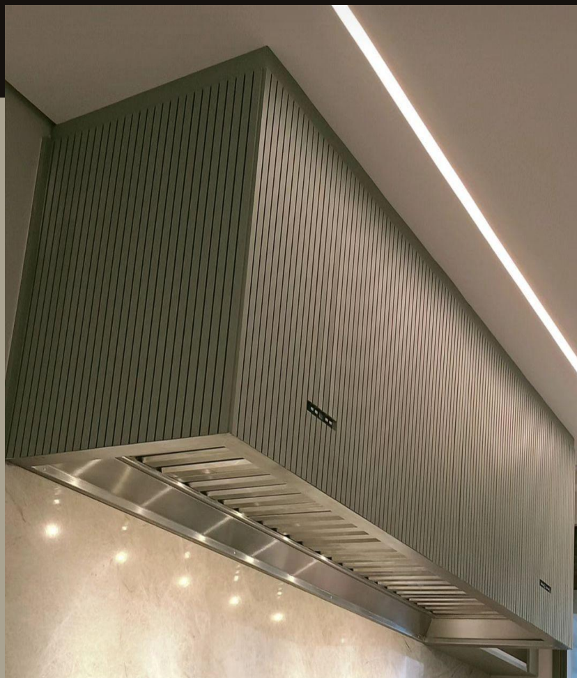
COIFA INOX COM FRISOS

Para informações de preço, instalação e outros modelos de produto, consultar o vendedor.